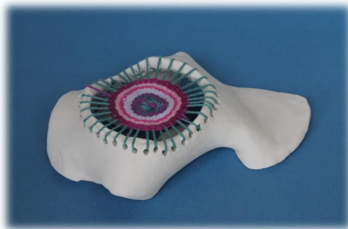
Maša Felc, 7. razred OŠ Črni Vrh