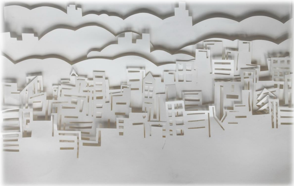
Deja Razpet, 9. razred OŠ Cerkno