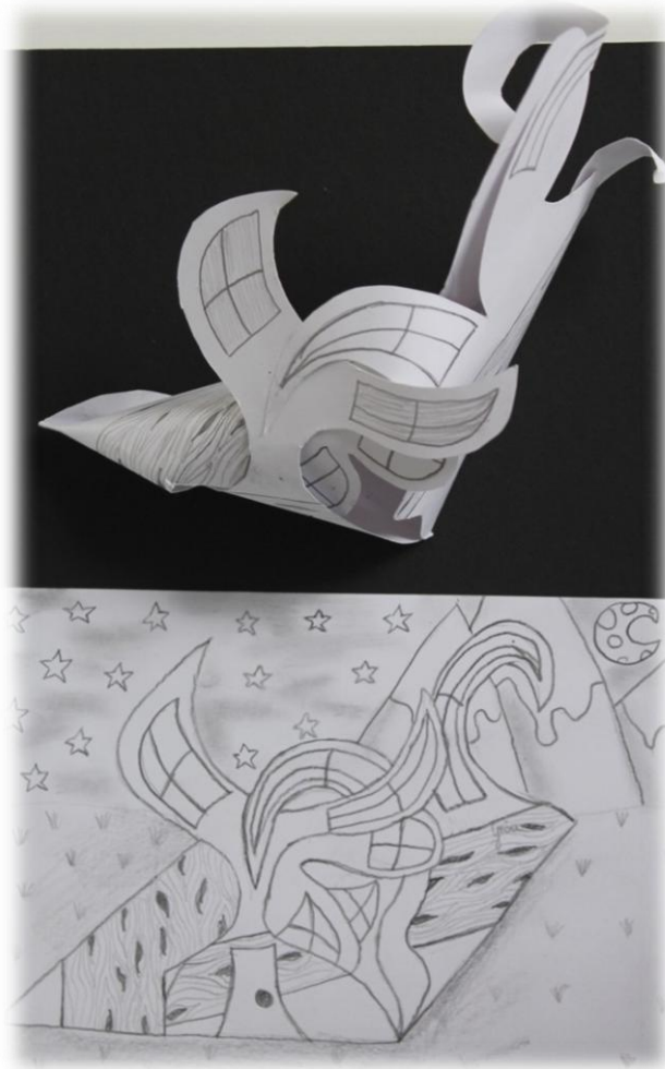
Meilin Grča, 7. razred OŠ Lucija