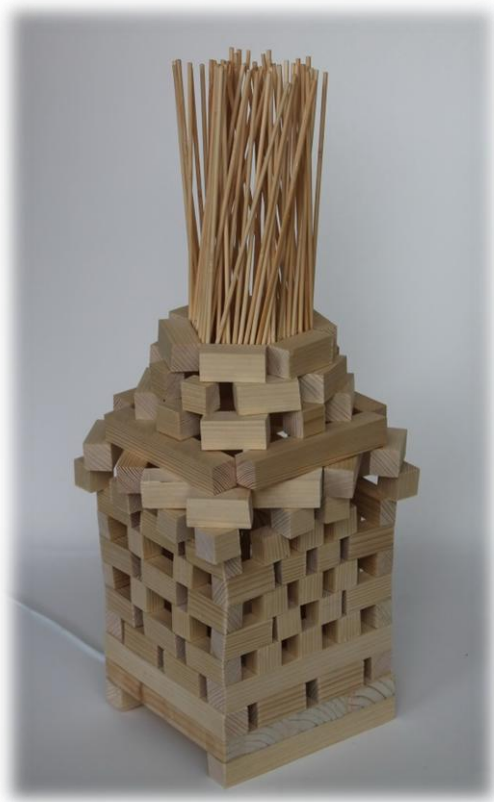
Jure Lazar in Tilen Sapač, 8. razred OŠ Puconci