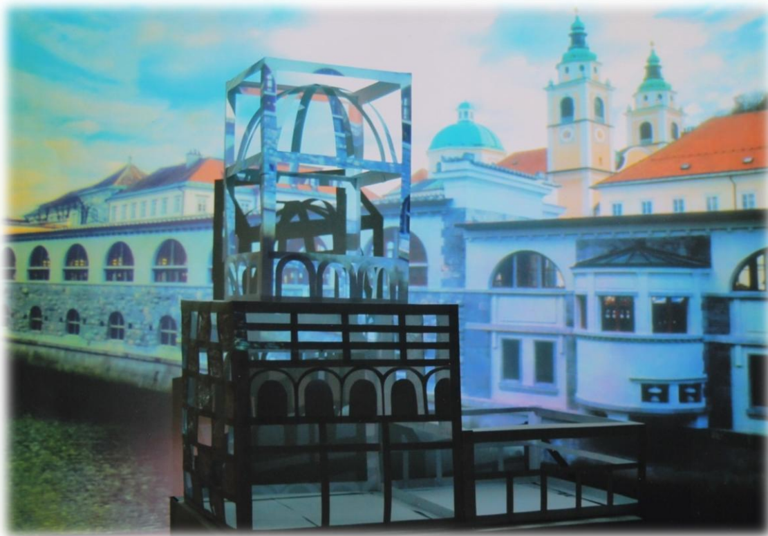
Lea Petretič, 8. razred OŠ Podbočje