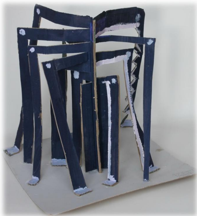
Leon Veljković, 7. razred OŠ Col