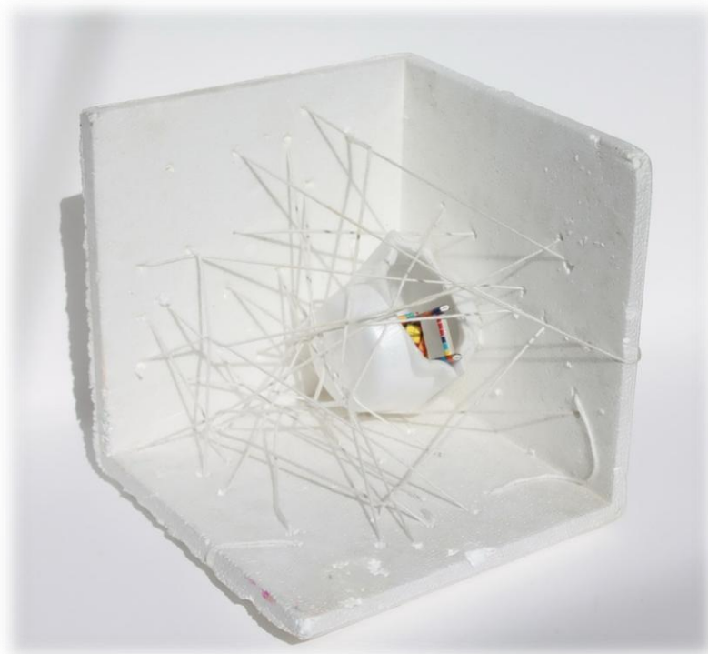
Tiana Uršič Radovanović, 7. razred OŠ Vrhovci Ljubljana