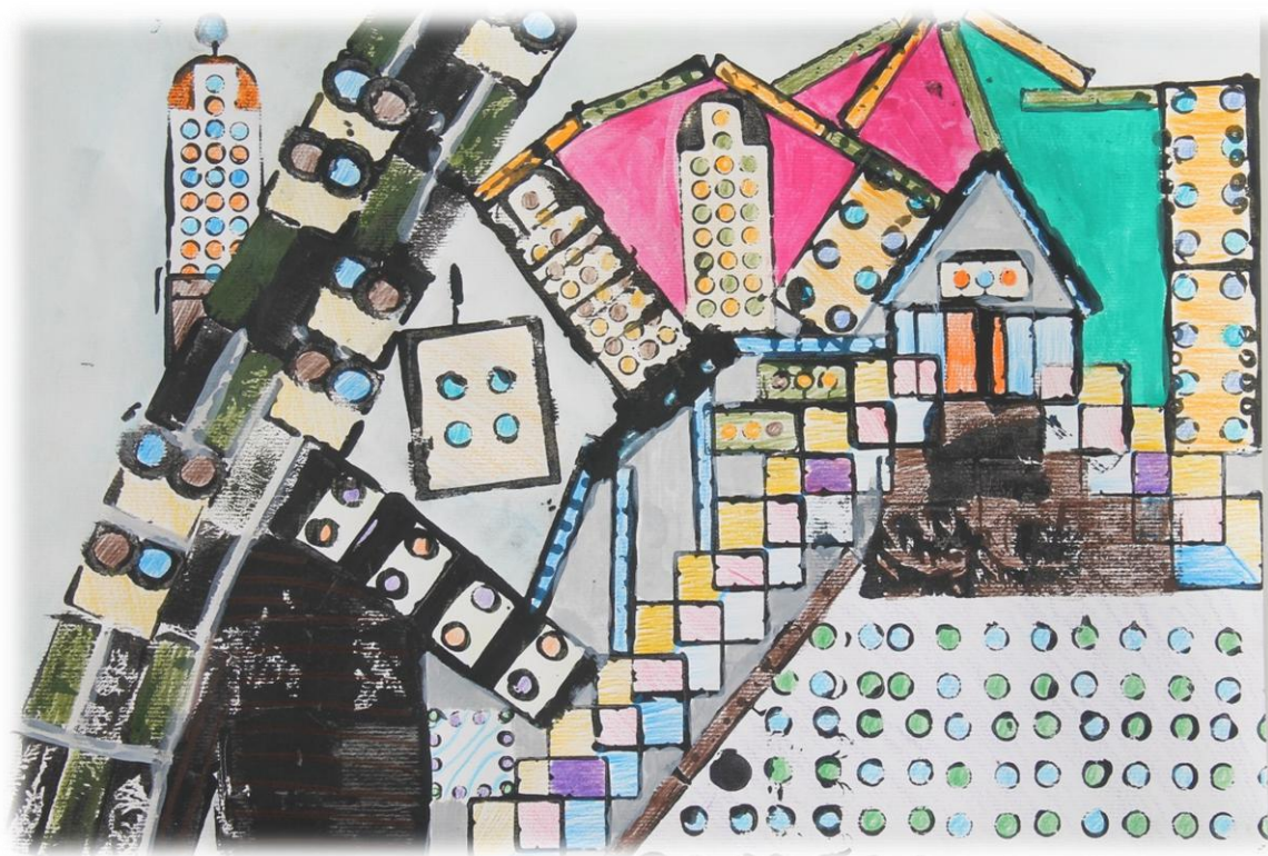
Gašper Rangus, 7. razred OŠ Prestranek