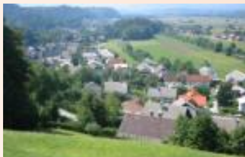
pogled na kriško polje